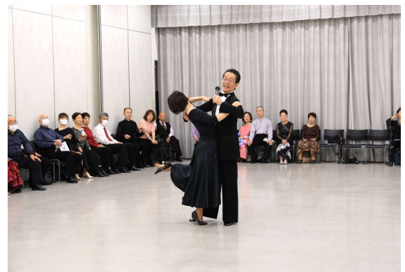
スローアウェイ・オーバースウェイからは、幾つかのパターンがあり、その一つの例を解説している様子