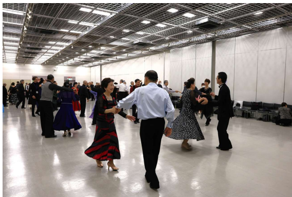
フリーダンスタイム

主催者挨拶の後は、20分間のフリーダンスタイム、続いて20分間のミキシングを行いました。