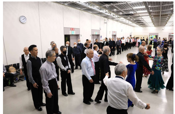
ミキシングダンスタイム