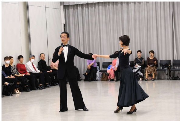
「ラテンの応用ステップ」の解説している様子

スローアウェイ・オーバースウェイを基にした変形ステップを取り上げ、姿勢とラインを美しく見せるポイントを解説して頂きました。こちらも短時間ですが、皆で練習しました。